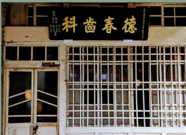
↑德春齒科

以上做爲「二」年度平原社區大學整年度概況說明之一二。最後我還是要呼籲：學習不能等，學習促進生命強度，學習促進社會韌度與發展，學習可以壯大國力。我們的美麗家園，依靠著每一位社大參與者的自信成長。與大家共勉！