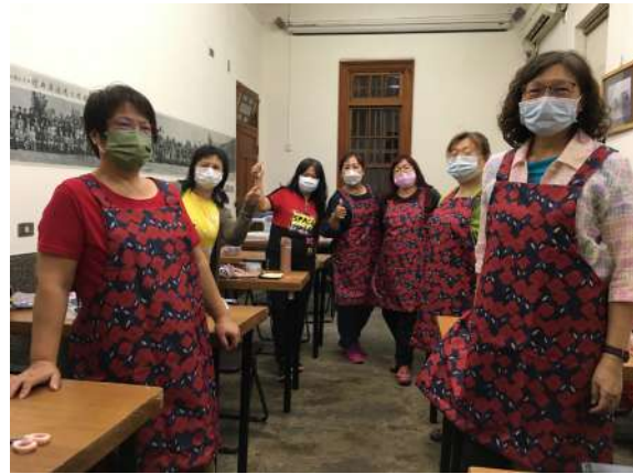
↑【111-2 生活藝術拼布】製作圍裙 (2022.10.18)