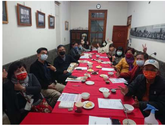
↑【111-1 校務會議】與校務委員會議後合影 (2022.01.19)