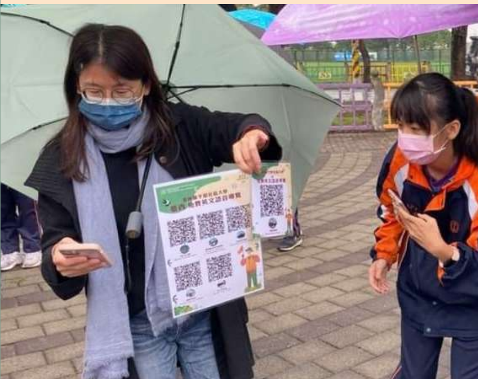
← 線上語音系統導覽說明使用

延續109年疫情之前的國際文化交流工作，112年起恢復中長期國際志工，協助進班擔任語文、工藝類教學工作。