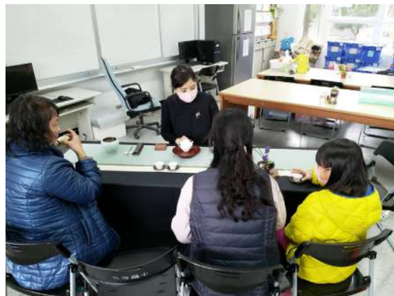
↑【111-1 以文藝會友工作坊】麥寮茶藝茶席 (2022.02.23)