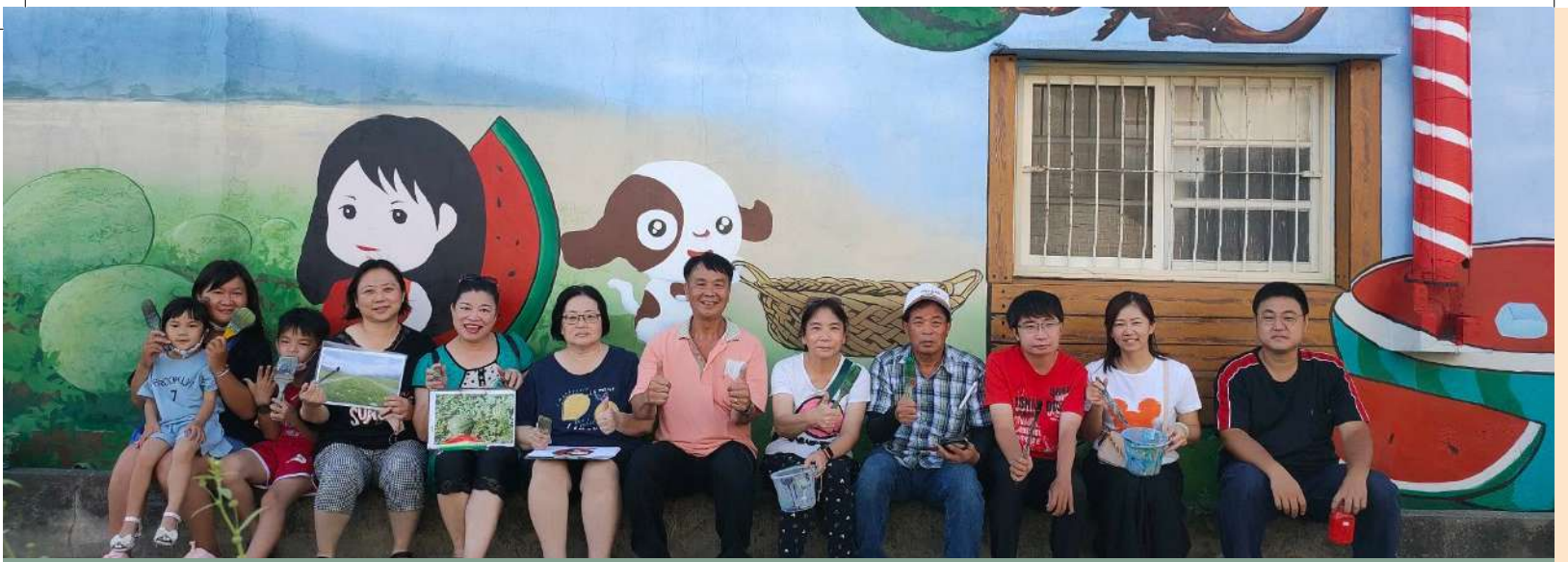
↑ 二崙 3D 彩繪班於四番地彩繪