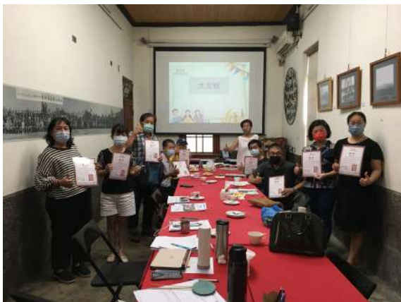
↑【111-2 校務會議】與校務委員會議後合影 (2022.08.06)