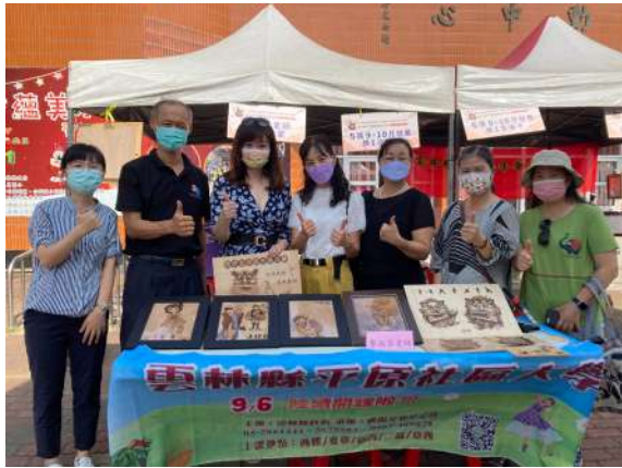
↑【111-2 詔漾烙夏趣】西螺七坎武術與烙畫藝術的結合 (2022.10.08)