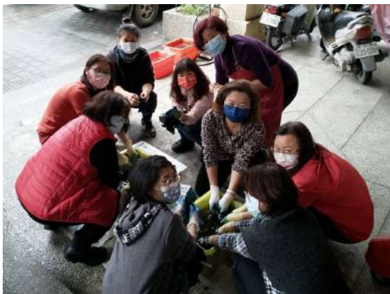
↑【111-1 以文藝會友工作坊】藍染工作坊 (2022.02.22)