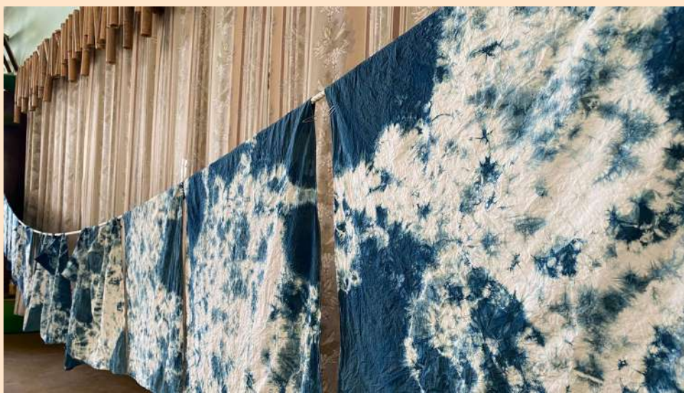
↑埤頭社區藍染課程

與大同醬油公司產學合作，成立「雲林社大醬油公社」，推出「雲林社大醬油」品牌，委託生產白曝醬油、台灣產銷履歷黑豆醬油兩款，招募社大師生參加，除深度帶領成員認識傳統製醬產業外，並將營運利潤所得捐作公益，一舉數得。