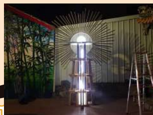
↑ 埔羌樹的故事 - 陳右承