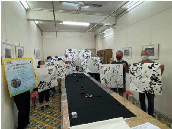
↑【111-2 暑期創意工作坊】創藝書寫工作坊 (2022.07.30)