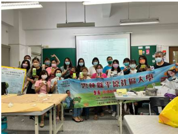
↑【111-2 暑期創意工作坊】創意手工皂工作坊 (2022.08.03)