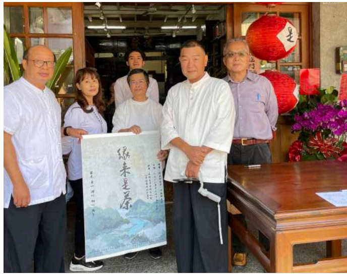
↑緣來是茶 茶席饗宴合照