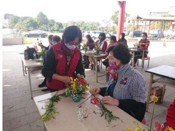
↑【111-1 以文藝會友工作坊】二崙四季花藝工作坊 (2022.02.16)