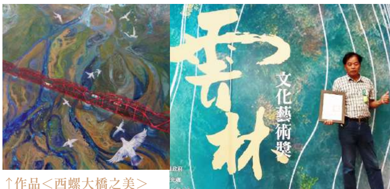
↑作品〈西螺大橋之美〉