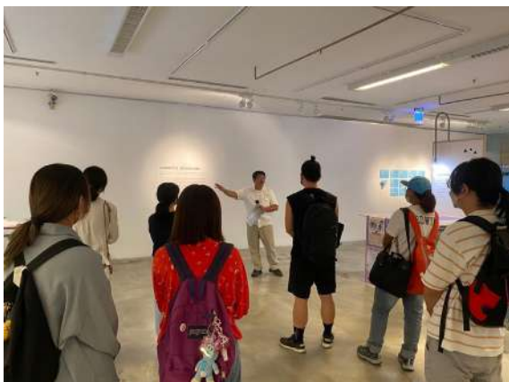
↑【111-2 南部社大聯誼會】專員參與供時代-社區大學公共性博覽會 (2022.10.04)