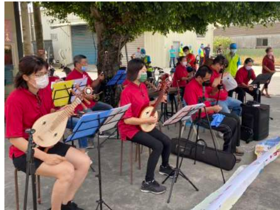
↑【111-1 埔心初階國樂班】西螺順天宮前表演 (2022.07.17)