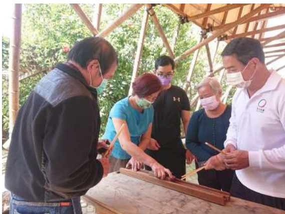
↑【111-1 班代增能培訓講座工作坊】榆木筷子製作工作坊 (2022.03.12)