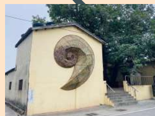
↑ 時間螺旋 - 李蕢至