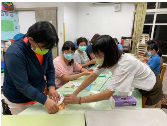
↑【111-2 暑期創意工作坊】創意黏土工作坊 (2022.08.03)