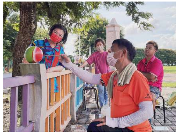
↑【111-1 3D彩繪與鉛筆素描】以二崙鄉代表農作物西瓜為主題彩繪崙西公園 (2022.06.26)