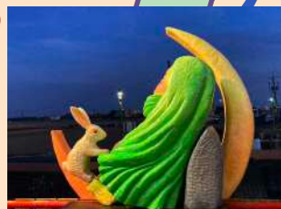
↑ 等待美好酸甘味 - 關有仁