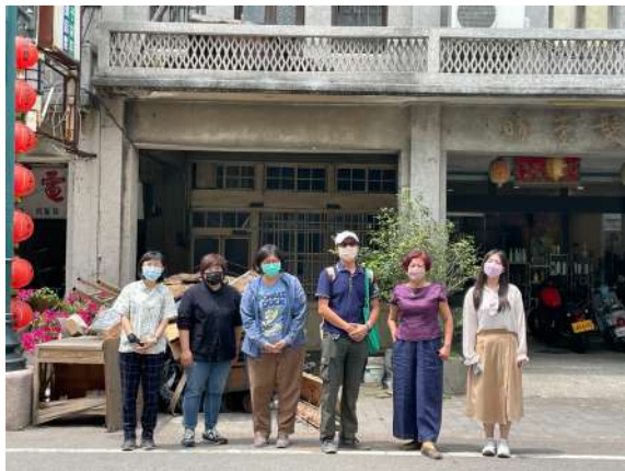
↑【111-1 全促會】新入會社大拜訪與交流 (2022.04.15)