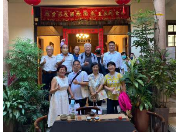
↑【111-2 111 年度社區大學評鑑】工作人員與評鑑委員合影 (2022.11.10)