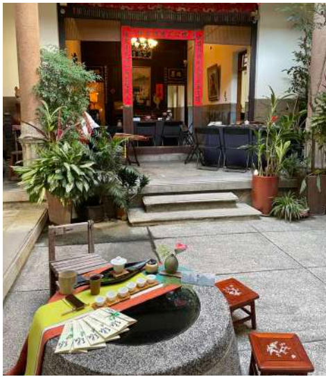
↑緣來是茶 茶席饗宴

最後感謝平原社大提供優質的師資與上課場所，在課堂上同學們用心地佈席和古色古香的建築相互呼應下，真心覺得把茶帶進生活中，不是急促就章一杯解渴而已，而是藉由茶席美學與茶品、器物、大自然的小花、枯木等彼此襯映且衝擊你的視覺藝術，一泡好茶喚醒你的味覺與嗅覺享受，為自己打造的生活儀式感，在茶事生活中需要一雙會發現美的眼睛，與茶器物相約在茶事之中，改變原有的生活軌跡。