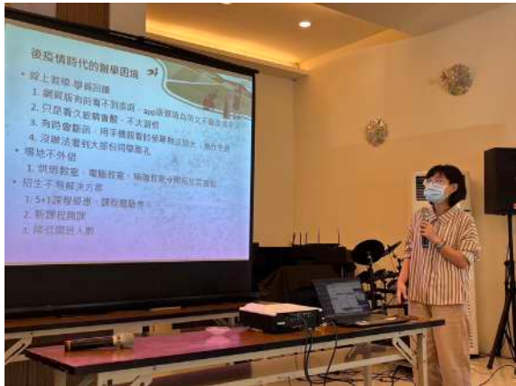
↑【111-2 社區大學創新優質課程】創新優質課程行政人員分享 (2022.11.18)