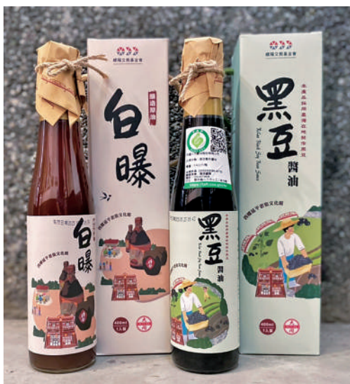
↑公益品牌的雲林社大醬油

同時亦建立在地具指標性、帶動地方產業特色發展之平台，讓傳統製醬過程、食醬文化以不同新意推廣出去。