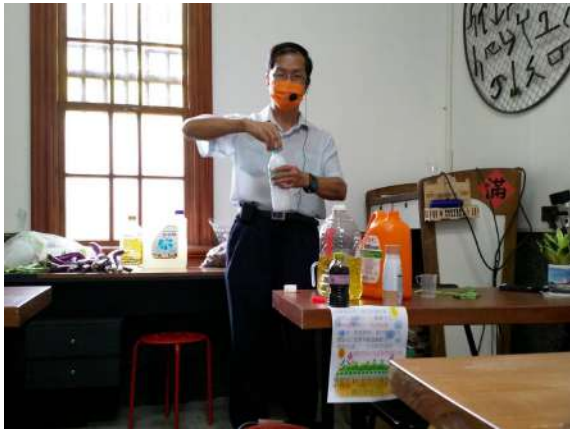
↑【111-2 植物有機栽培】開學前工作坊 - 自製有機農藥 (2022.07.12)