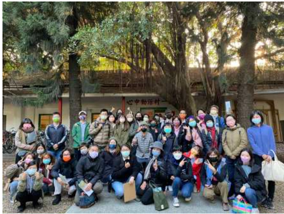
↑【111-1 南部社大聯誼會】專員與其他社大交流 (2022.01.11)