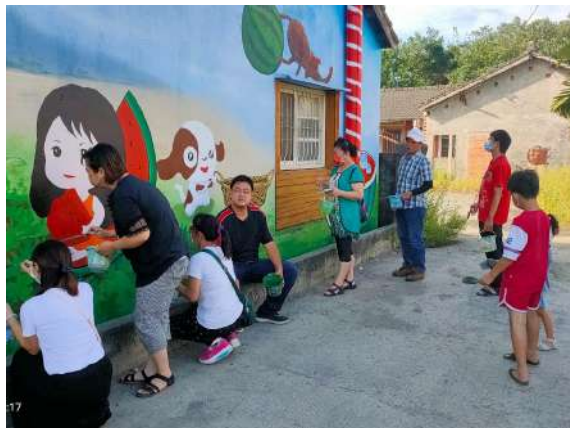
↑【111-2 3D 彩繪與鉛筆素描】以西瓜為主題彩繪民宅外牆 (2022.09.24)