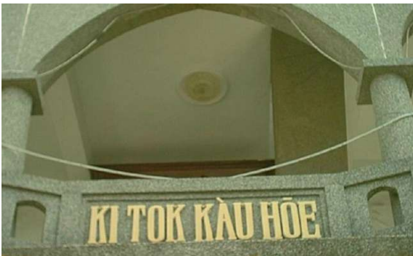
↑台語羅馬字（基督教會）