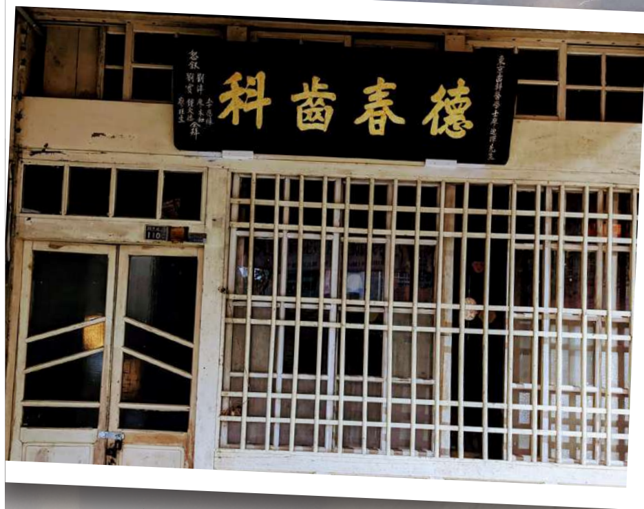
德春齒科的未來與想像