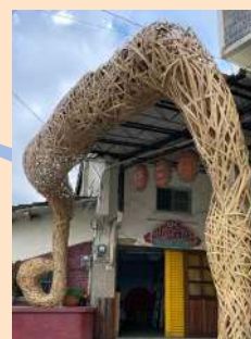
↑ 同心門 - 何美慧