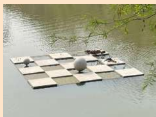
↑ 漂浮詩格 - 張伯豪