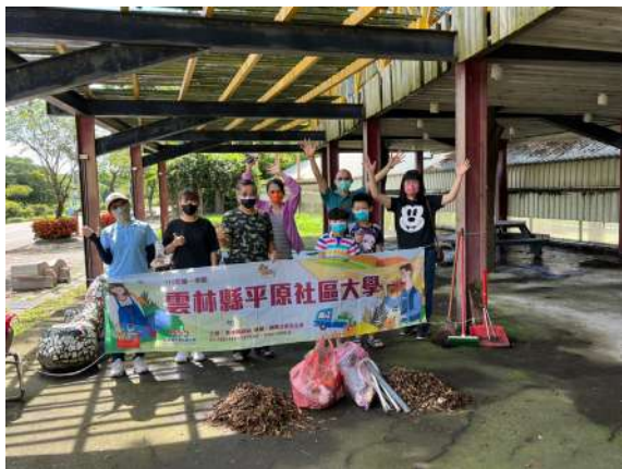
↑【111-1 素描與炭畫教學】西螺大橋廣場周遭環境清掃 (2022.06.26)