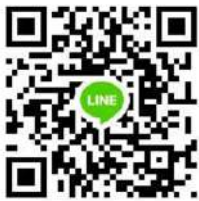
↑西螺老屋活化實踐社 LINE 群組