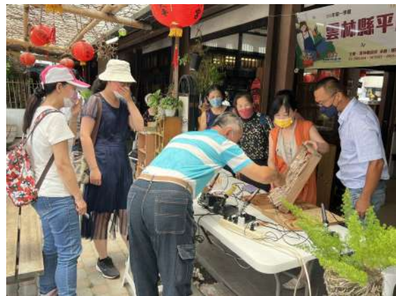
↑【111-1 輕鬆玩烙畫】東市場教學 (2022.07.03)