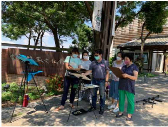
↑【111-1 詔安風情水彩速寫】詔安文化館寫生活動 (2022.06.22)