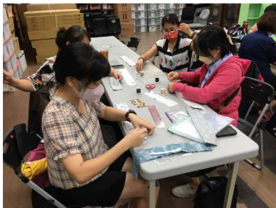
↑【111-2 暑期創意工作坊】創意拼布工作坊 (2022.08.03)