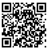
↑線上成果展 QR Code