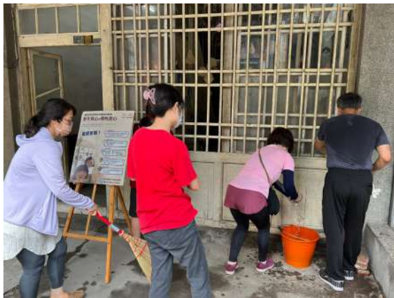
↑【111-1 聯合社區回饋】老屋環境整備 (2022.06.24)