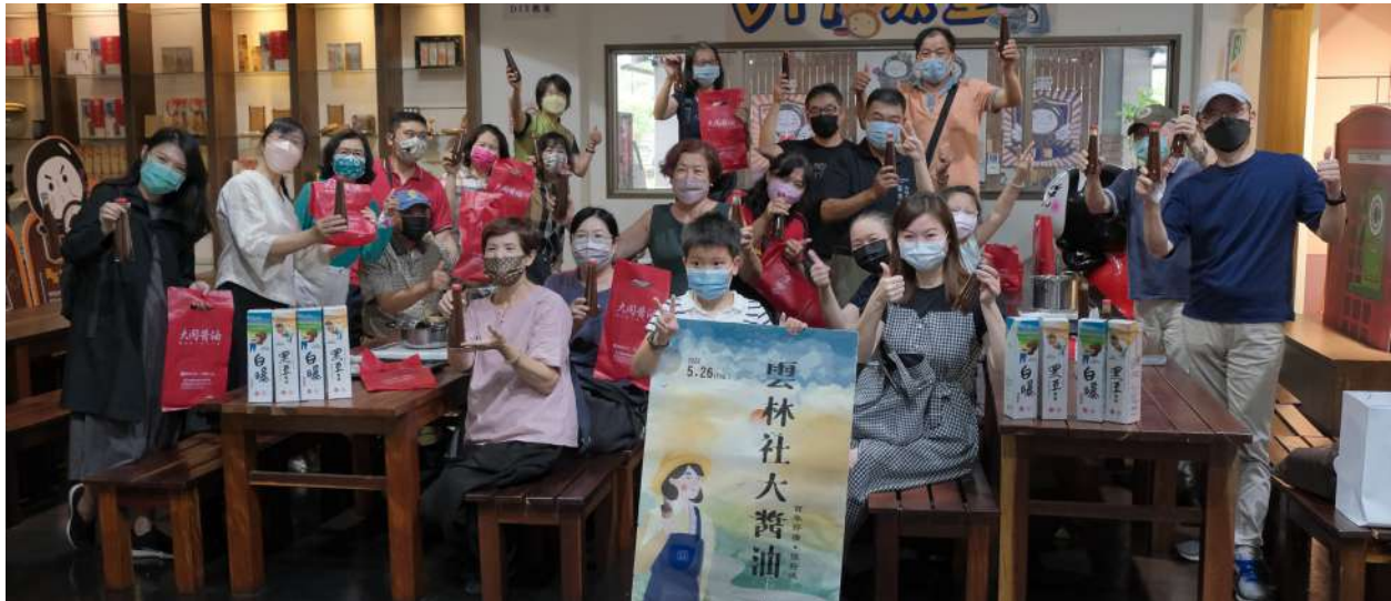
↑雲林社大醬油公社社員合影

的單品，從早餐——九層粿開始，午餐——碗粿，同時身為醃料也同時作為醬料，亦可作為高湯來源或是滷汁靈魂。