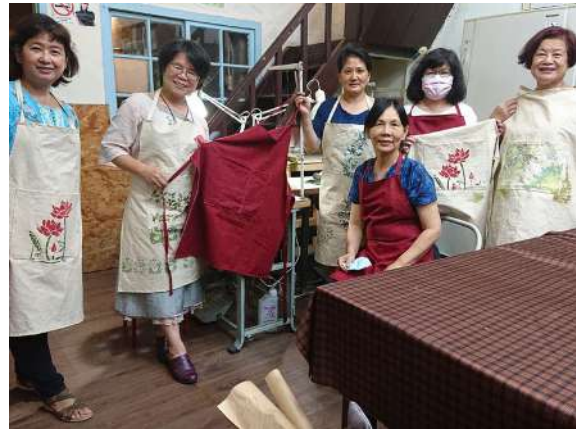
↑【111-1 螺陽裁縫手作】製作圍裙 (2022.06.23)