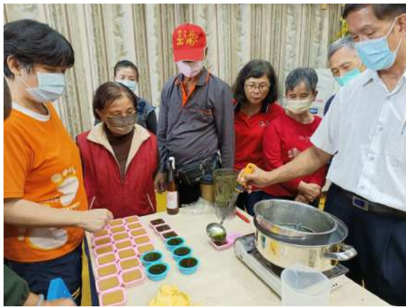
↑【111-2 植物有機栽培】至埔頭里教社區居民製作手工皂 (2022.12.06)