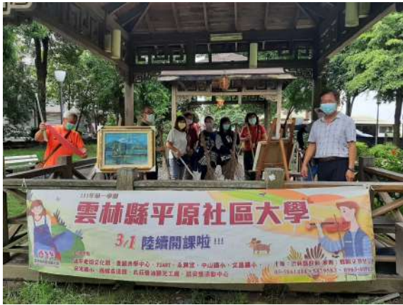
↑【111-1 西螺創意油畫】至振文書院前公園清掃環境並戶外寫生 (2022.07.03)