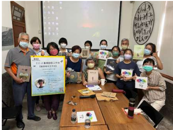
↑【111-2 暑期創意工作坊】創意繪本工作坊 (2022.07.30)