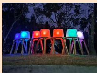
↑ 浮森林 - 吉田敦