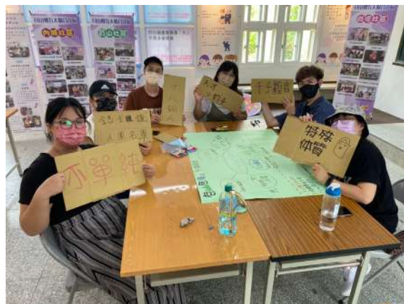
↑【111-1 社區大學工作人員研習營】與其他社大交流 (2022.08.04)