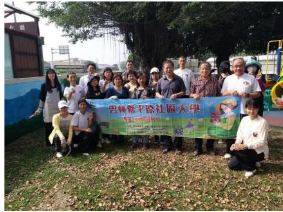
↑【111-2 西螺、麥寮創意油畫與太極拳】麥寮興華國小彩繪圍牆 (2022.11.13)