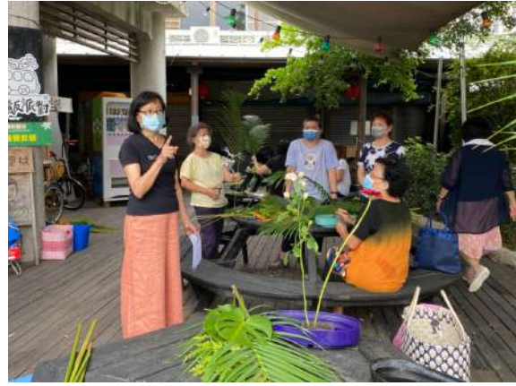
↑【111-1 游逸花草花藝】東市場插花 (2022.06.15)