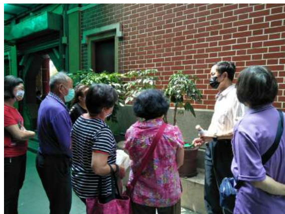
↑【111-1 植物有機栽培】為廣福宮兩邊樹把脈 (2022.04.12)