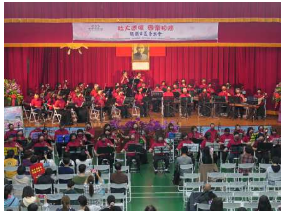
↑【111-2 社區回饋】社大送暖·國樂相隨 獨韻音樂會 (2022.12.10)